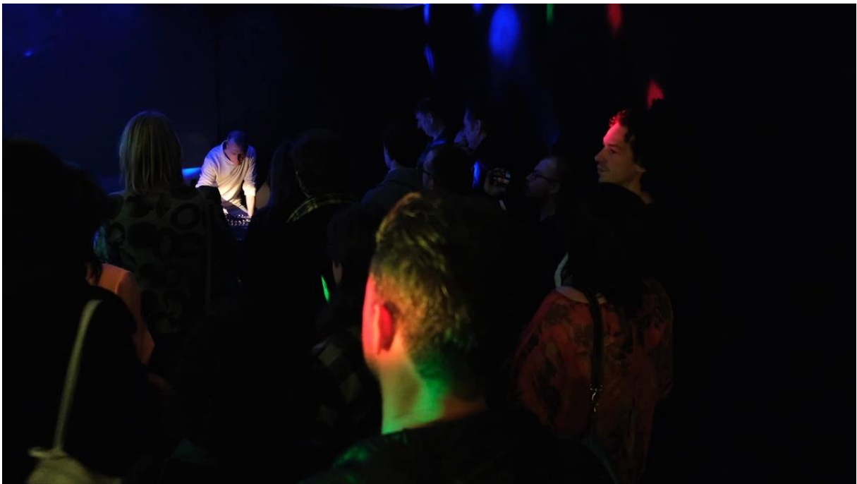
Eric Von Stroheim tijdens opening There is a Storm, Copy That in het AAP