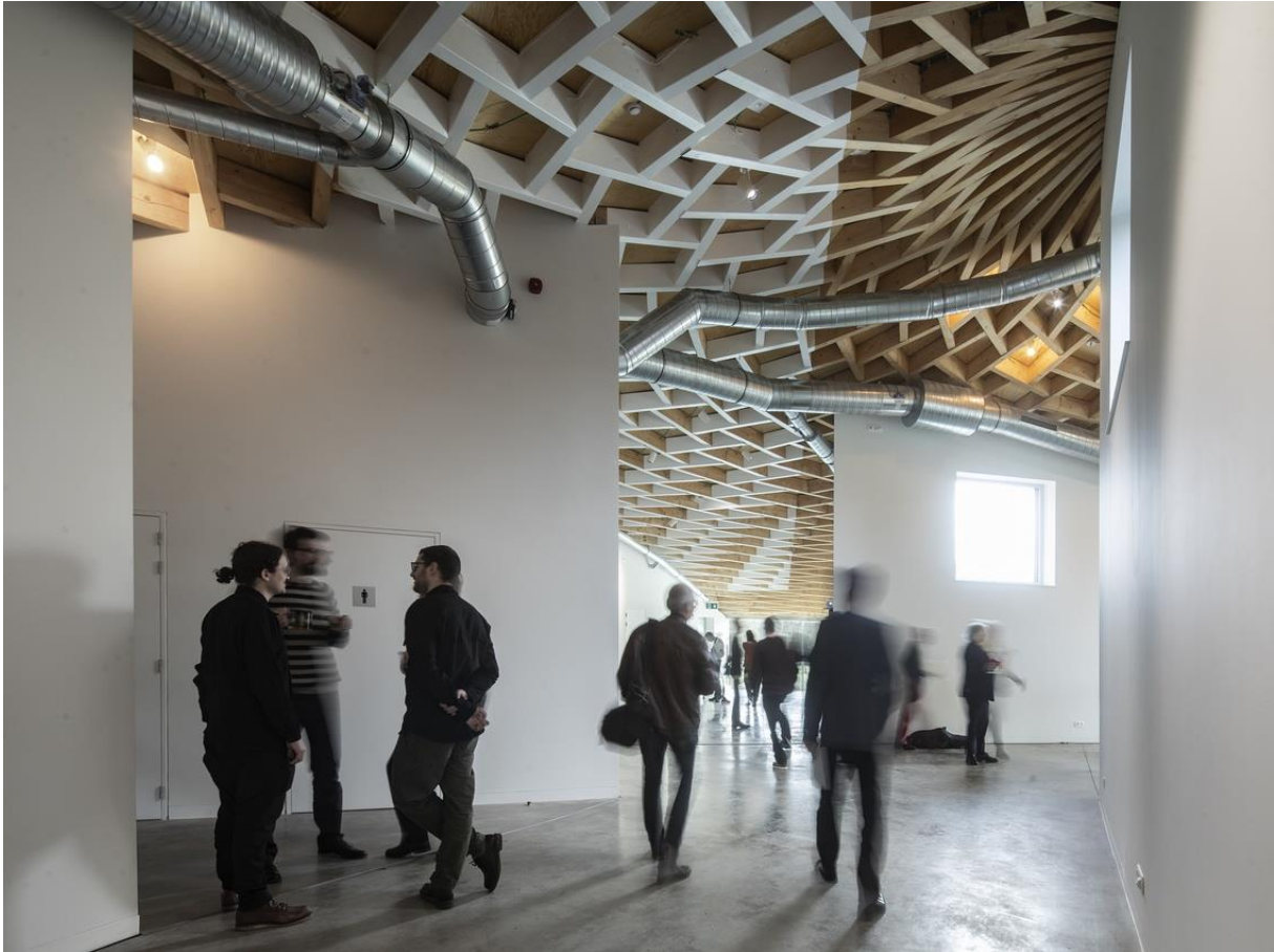
Opening van de uitbreiding van het Frans Massereel Centrum