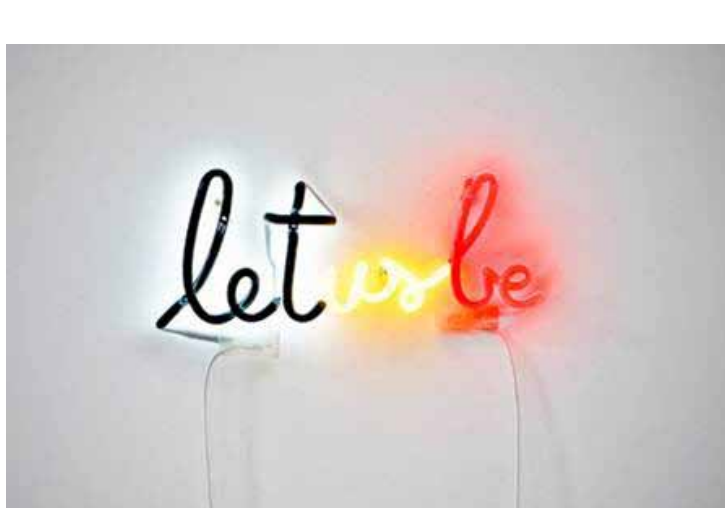
© Lieven De Boeck, Let us be (2012)

Lieven de Boeck is een kunstenaar van wie het werk zich op twee niveaus tegelijk ontwikkelt. Enerzijds maakt hij observaties over de publieke ruimte die zowel onze dagelijkse realiteit als de context van om het even welke kunstpraktijk definieert. Anderzijds concentreert hij zich op zijn alles omvattende project, namelijk 'the dictionary of space'. Dit woordenboek formuleert concepten met betrekking tot architecturale thema's zoals bezetting, toe-eigening, grenzen, territoriums, representatie en identiteit. 'Dictionary of space' heeft zich in verschillende contexten ontwikkeld gaande van tussenkomsten in tijdschriften, publicaties, performances en teksten tot tekeningen, modellen, installaties en video. www.studiolievendb.com